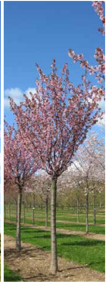
Zierkirsche „Prunus sargentii“