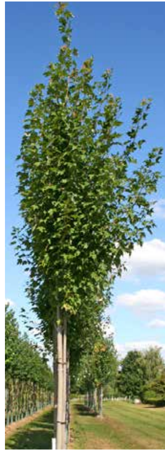
Ahornbaum „Acer freemanii Armstrong“

12 Ahornbäume und 3 Zierkirschen werden für ein angenehmes Ambiente sorgen. Zusammen mit Blumenkübeln und neuen Anpflanzungen unter den bestehenden Großbäumen entsteht ein Gesamtbild mit viel Charme, das zum Schlendern und Verweilen einlädt und zum Sich-Wohlfühlen beiträgt. Die genauen Standorte können Sie aus den Plänen entnehmen.