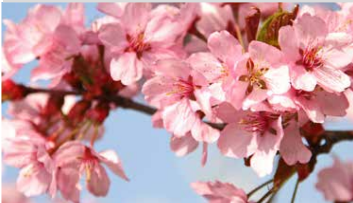
Die Zierkirsche blüht ab April mit schimmernden und lichtrosa Blütenwolken.